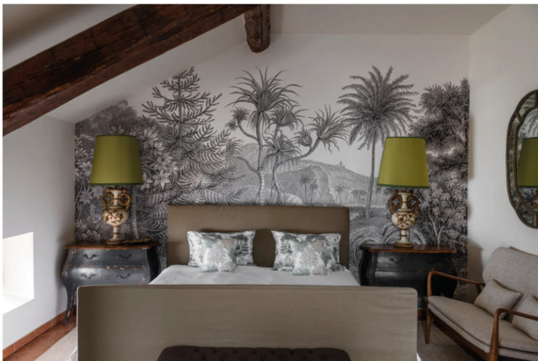
Agi Simoes & Reto Guntli.

El dormitorio principal presenta una suave paleta de colores de blancos, grises y verdes, realizada por el papel tapiz "Jungle Land" de Rebel Walls.