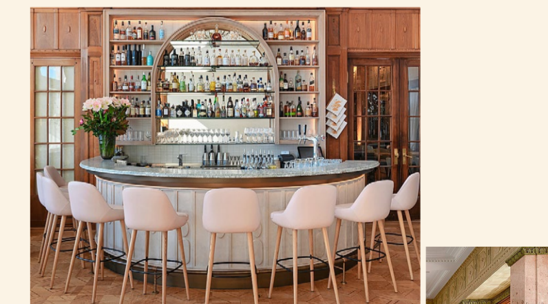
Die Louis Bar (Bild oben) und das Restaurant Scala (rechts) sowie die Seeterrasse (links) mit dem harmonischen Farbkonzzept.

Luzern Nachdem 2022 in einer ersten Phase die komplette Renovierung von 26 Doppel- und Einzelzimmern, darunter fünf Junior-Suiten, durchgeführt wurde, erstrahlt seit Januar 2024 das Restaurant Scala, die Louis Bar und die Hemingway Rum Lounge in neuem Glanz. Das sanfte Rosé und Aquagrün der Möbel wurde von der Halle inspiriert, mit ihrer rosafarbenen Marmoraukleidung und dem dunkelgrünen Stein des ursprünglichen Kamin.