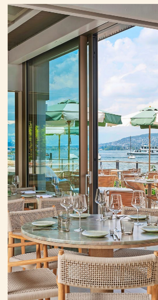
Blick auf die Terrasse (Bild oben) und ins Innere (Bild unten) des wiedereröffneten Restaurants.