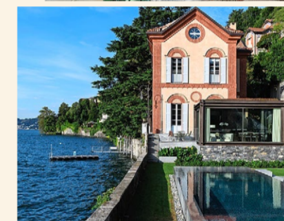
Neuer Stahl-Glas-Anbau und Pool (Bild links). Kücheninsel mit Bronze-Türen (Bild unten), kombiniert mit dem aussergewöhnlichen Stein Calacatta Arni.